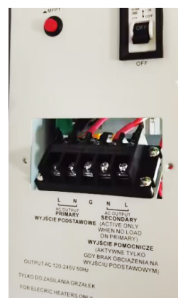
GREEN BOOST MPPT 3000T