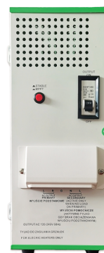
GREEN BOOST MPPT 3000T